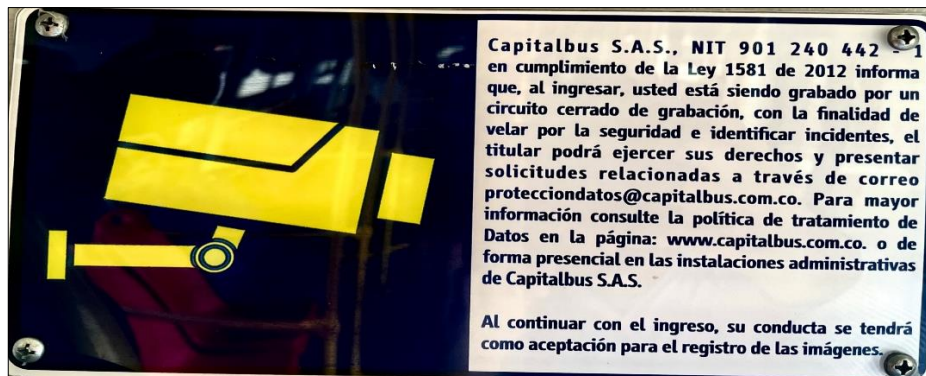
Señal de grabación – Esquema estándar vehículo

Mediante avisos publicados en las instalaciones y buses biarticulados, Capitalbus S.A.S. informa acerca de la instalación de cámaras de video y recolección de imágenes y videos, como se puede observar a continuación: