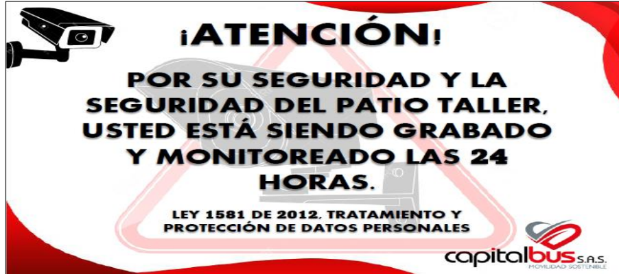
Señal de grabación – Esquema estándar Patio Taller Américas